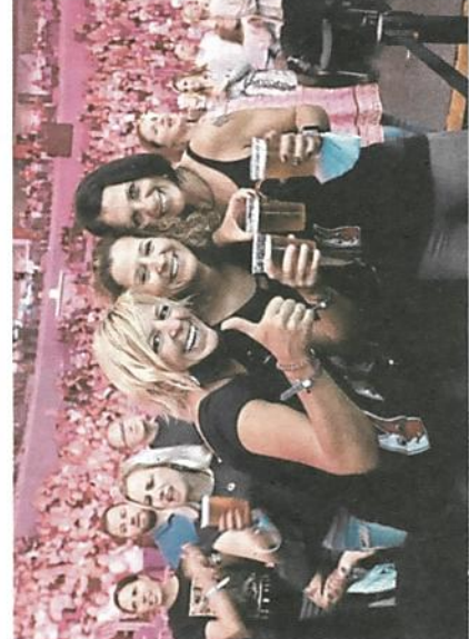
Viel Spaß hatten die Besucher: Endlich wieder unter